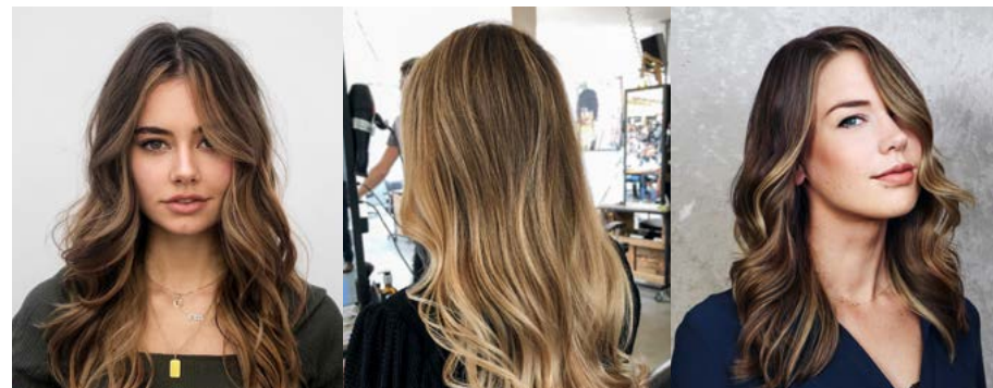
Freehand balayage + colormelt Balayage 1/1 + rootshadow Faceframe + basiskleur