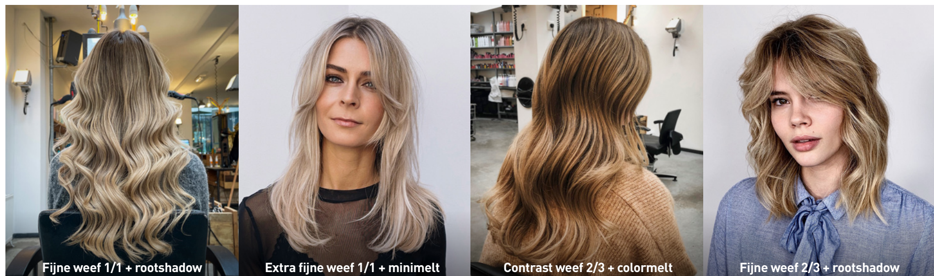
Fijne weef 1/1 + rootshadow