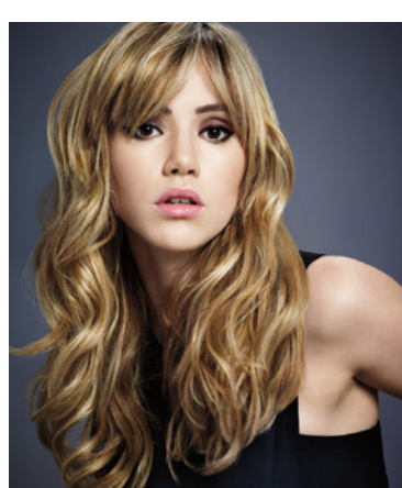
1/1 hoofd contrast weef