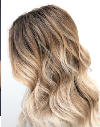
1/3 hoofd contrast weef + color melt