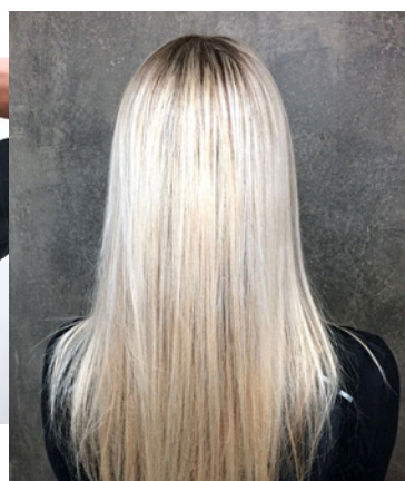
Extra fijne weef