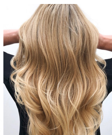
2/3 hoofd fijne weef