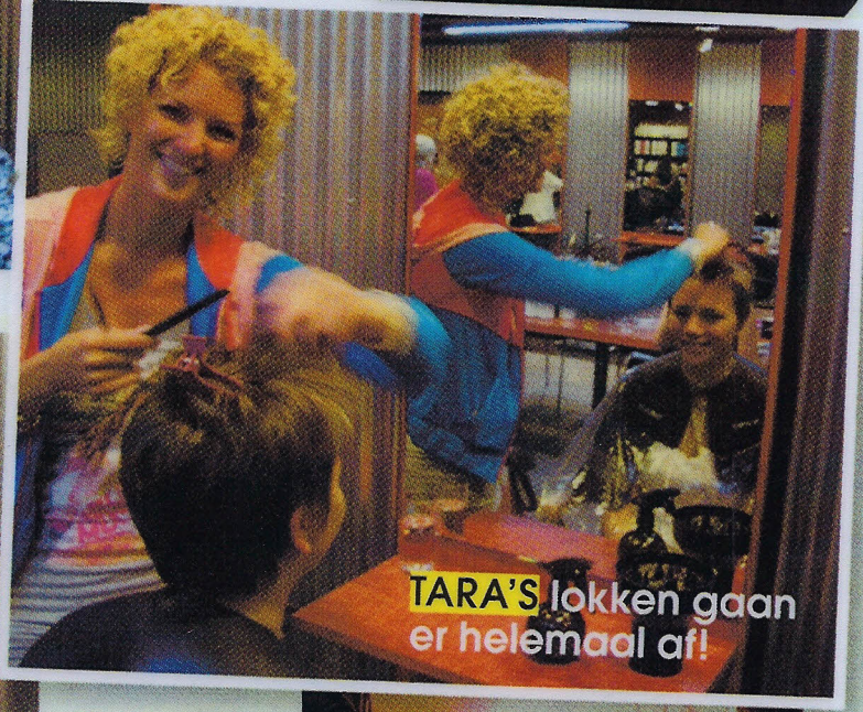
TARA'S lokken gaan er helemaal af!